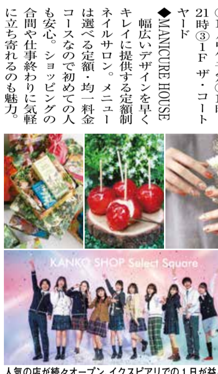
人気の店が続々オープン、イクスピアリでの1日が益々充実