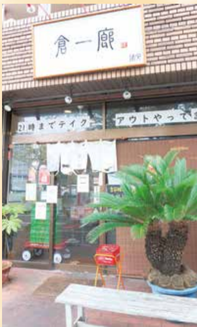
中華料理店「倉一廊」