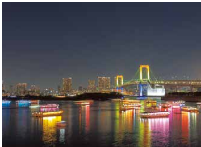
お台場の夜景を満喫できる (写真はイメージ)

浦安遊漁船協同組合 形船を気軽に楽しめる、浦安の伝統である屋形「乗合屋形船」の秋冬の