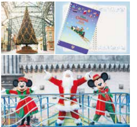
ほかでは手に入らないリングノート(右上)。クリスマスを楽しむ分楽しもう!