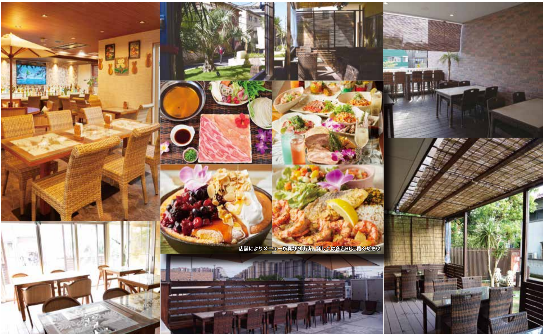
店舗によりメニューが異なります。詳しくは各店HPをご覧ください