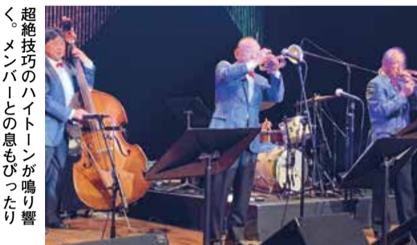
超絶技巧のハイトーンが鳴り響く。メンバーとの息もぴったり