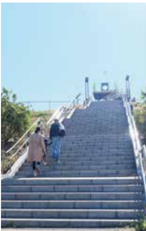
高洲海浜公園展望台

私たちが暮らす浦安を歩いてみよう。小さな発見があるかもしれない。今回は「高洲」。海を望む公園などを巡った。高洲橋からスタートし、橋上から境川を見渡し、河口に近いこのあたりに近づく。階段を下り、境川に沿って歩く。並木が枝を伸ばす。快適な緑道だ。犬を連れて散歩する女性やジョギングする人が行き交う。