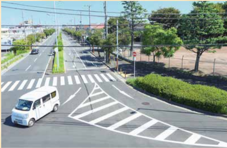
東野3丁目の交差点